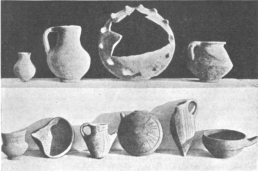
Домашняя утварь въ древней Палестинѣ.