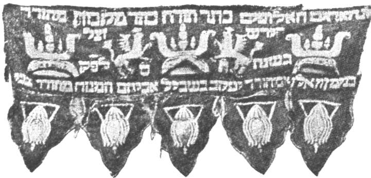
Шитая золотомъ завѣса въ Сандомирской синагогѣ (1700 г.).

Правительственный антисемитизмъ.— Вліяніе русской радикальной литературы на еврейскую молодежь.— Пробужденіе національнаго самосознанія и идейные выразители его въ еврейской литературѣ.— Появленіе русско-еврейскихъ органовъ въ 80-хъ годахъ.— Погромы.— Майскія правила 1882 года.— Лозунгъ эмиграціи.— Америка или Палестина.— „Автоэмансипація“ и „возрожденіе еврейскаго народа“. — Организація палестинскихъ кружковъ.— Дальнѣйшія ограничительныя мѣры правительства въ области просвѣщенія и въ области экономической.— Экономическое положеніе евреевъ въ концѣ 80-хъ годовъ.— Гоненія на евреевъ внутреннихъ губерній въ началѣ 90-хъ годовъ.— Выселеніе евреевъ изъ Москвы.— Усиленіе эмиграціи въ началѣ 90-хъ годовъ.— Реакція внутри еврейства.— Сіонизмъ.— Еврейское рабочее движеніе.—Послѣднее десятилѣтіе.