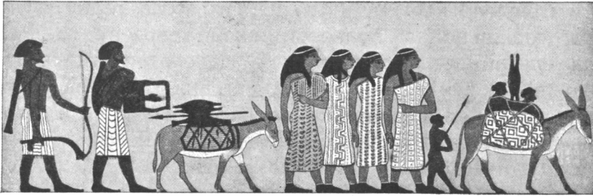
Семитскіе кочевники переселяются въ Египетъ.

Введеніе: Просвѣщенный абсолютизмъ и французская революція въ ихъ отношеніи къ вопросу о гражданскомъ бытѣ евреевъ; умственное пробужденіе западно-европейскаго еврейства подѣ влияніемъ просвѣтительныхъ идей XVIII вѣка.— Исторія евреевъ на Европейскомъ континентѣ въ эпоху революціи и Наполеоновской имперіи.— Эпоха реакціи (1815—1830).— Духовная культура евреевъ въ Западной Европѣ въ первой половинѣ XIX в.— Эмансипація евреевъ на Европейскомъ континентѣ.— Борьба за эмансипацію до 1848 г.— 1848 годъ.— Постепенное приобрѣтеніе гражданскихъ и политическихъ правъ (въ 50-хъ и 60-хъ гг.).— Тридцатилѣтняя борьба за эмансипацію англійскихъ евреевъ.— Евреи въ Соединенныхъ Штатахъ, начиная съ эпохи борьбы за независимость до иммиграціи русскихъ евреевъ.— Послѣдствія эмансипаціи.— Успѣхи евреевъ на культурномъ и экономическомъ поприщахъ.— Зарожденіе и развитіе антисемитизма.— Пробужденіе національнаго самосознанія.— Палестинофильство, сіонизмъ и другія общественныя движенія въ еврействѣ.— Евреи на Балканскомъ полуостровѣ и въ Палестинѣ.— Евреи въ Америкѣ, Азіи и Африкѣ.