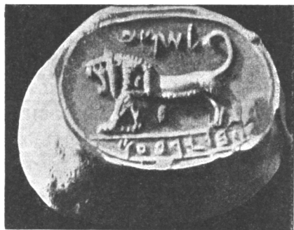
Печать Шемы. „слуги Іеробеама“ (VIII в. до Р. X.).

Всѣ эти стремленія были, конечно, не въ силахъ остановить процессъ соціального развитія, но лежавшій въ основѣ ихъ принципиальный протестъ противъ всѣхъ отрицательныхъ явленій культуры уже предопредѣлялъ содержаніе той программы религиозно-соціальныхъ реформъ, съ которой вскорѣ выступили великіе пророки.