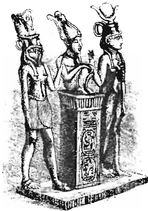
Озирисъ, Горусъ и Изиды.

XXVIII. Теперь закончимъ разсмотрѣніе именъ демоновъ и боговъ. Озирисъ и Изиды, будучи добрыми демонами, превратились въ боговъ; могущество же Тифона было разрушено и уничтожено, и закончилось послѣдними рыданіями и предсмертными судорогами. Въ память его не существуетъ ни жертвоприношеній, ни обрядовъ богослуженія, напротивъ, при нѣкоторыхъ празднествахъ, Тифона низвергаютъ и поносятъ. Въ память его во время мистерій иногда оскорбляютъ и поносятъ даже рыжеволосыхъ людей, а Колтиты сбрасываютъ со скалы рыжаго осла, такъ какъ Тифонъ былъ рыжій и именно такого же оттѣнка, какъ рыжій оселъ. Бюзириты и Ликополиты совершенно не употребляютъ музыкальныхъ трубъ, находя ихъ звукъ похо-